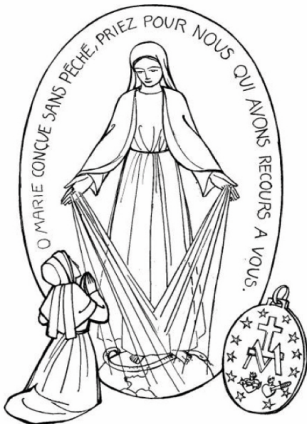
La médaille miraculeuse

Comme le Père t'a choisie, ô Marie (...) nous te choisissons aujourd'hui comme Mère et Reine de notre école et nous te consacrons notre âme et notre corps, toutes nos activités et tout ce que nous sommes, sans exception. (...) Ô Marie, donne à chacun de nous, d'accomplir chaque jour, dans un don personnel, la volonté du Père, pour que toute notre école soit un lieu où grandissent des saints pour l'Eglise d'aujourd'hui et de demain. Ainsi soit-il