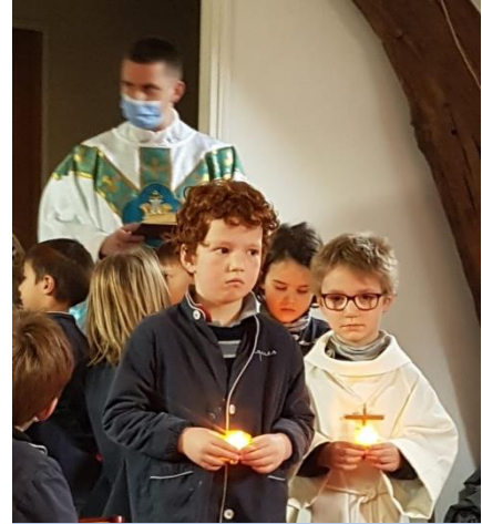
Messe de la Chandeleur – Présentation de Jésus au temple