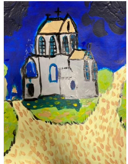
L'église de Cuiry-Housse façon Van Gogh par Diane.