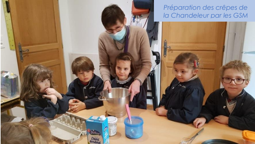
Préparation des crêpes de la Chandeleur par les GSM