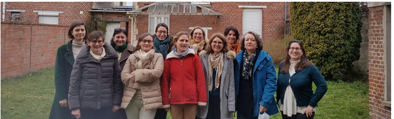
L'équipe enseignante au complet lors de la formation à La grammaire de la vie (+ 1 proche collaboratrice...)