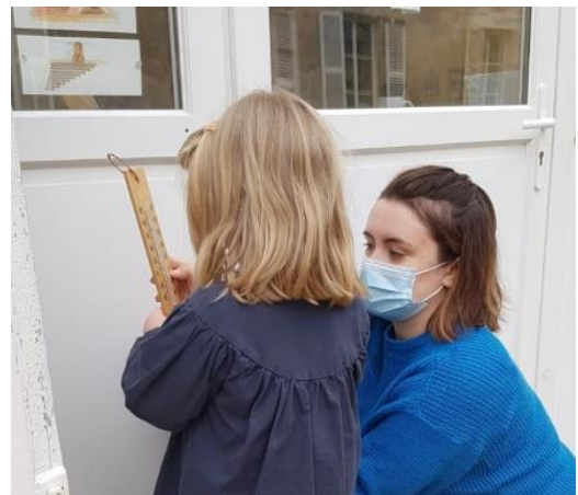
Mesure de la température en PS-MS Montessori