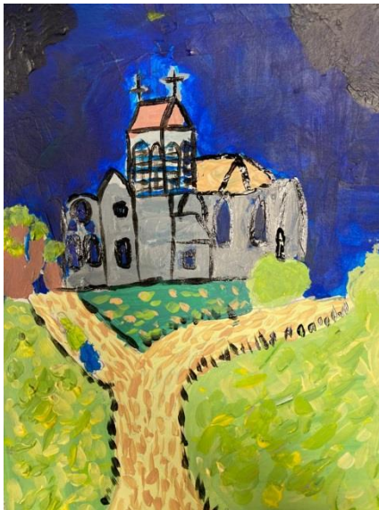
L'église de Cuiry-Housse façon Van Gogh par Gustave.