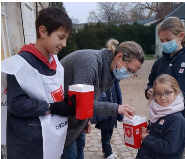
Collecte de l'Ordre de Malte pour les lépreux. Merci pour votre générosité !