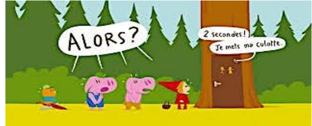
Extrait d'un album intitulé « Occupé » de Mathieu Maudet.